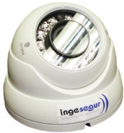
Mini Domo de Interior