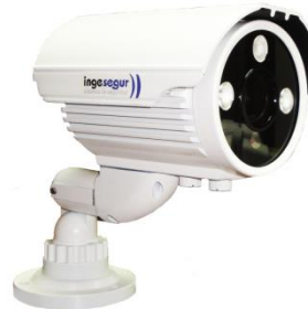
Cámara compacta de exterior