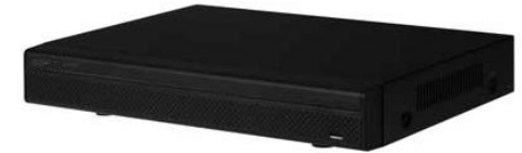
Grabador de 4 entradas