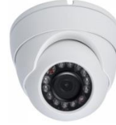
Cámaras HD de interior o exterior

CONSULTE NUESTRAS OFERTAS PARA GRANDES CLÍNICAS